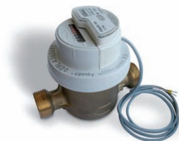
Aquadis+ PE z zamontowanym modułem